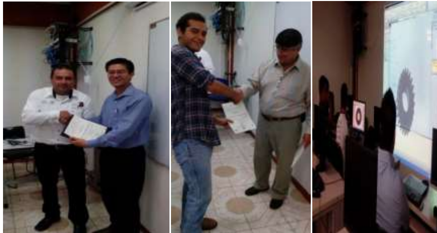
Alumnos que tomaron curso en diferentes cursos, talleres en la semana del 40 aniversario

En la semana del 40 aniversario la carrera de ingeniería electrónica desarrolló las siguientes actividades: Cursos de Robotc para Vex robotics, tarjetas embebidas, sistemas de energia con celda solar; conferencias de autómatas, conferencia de sistemas de comunicacion avanzado.