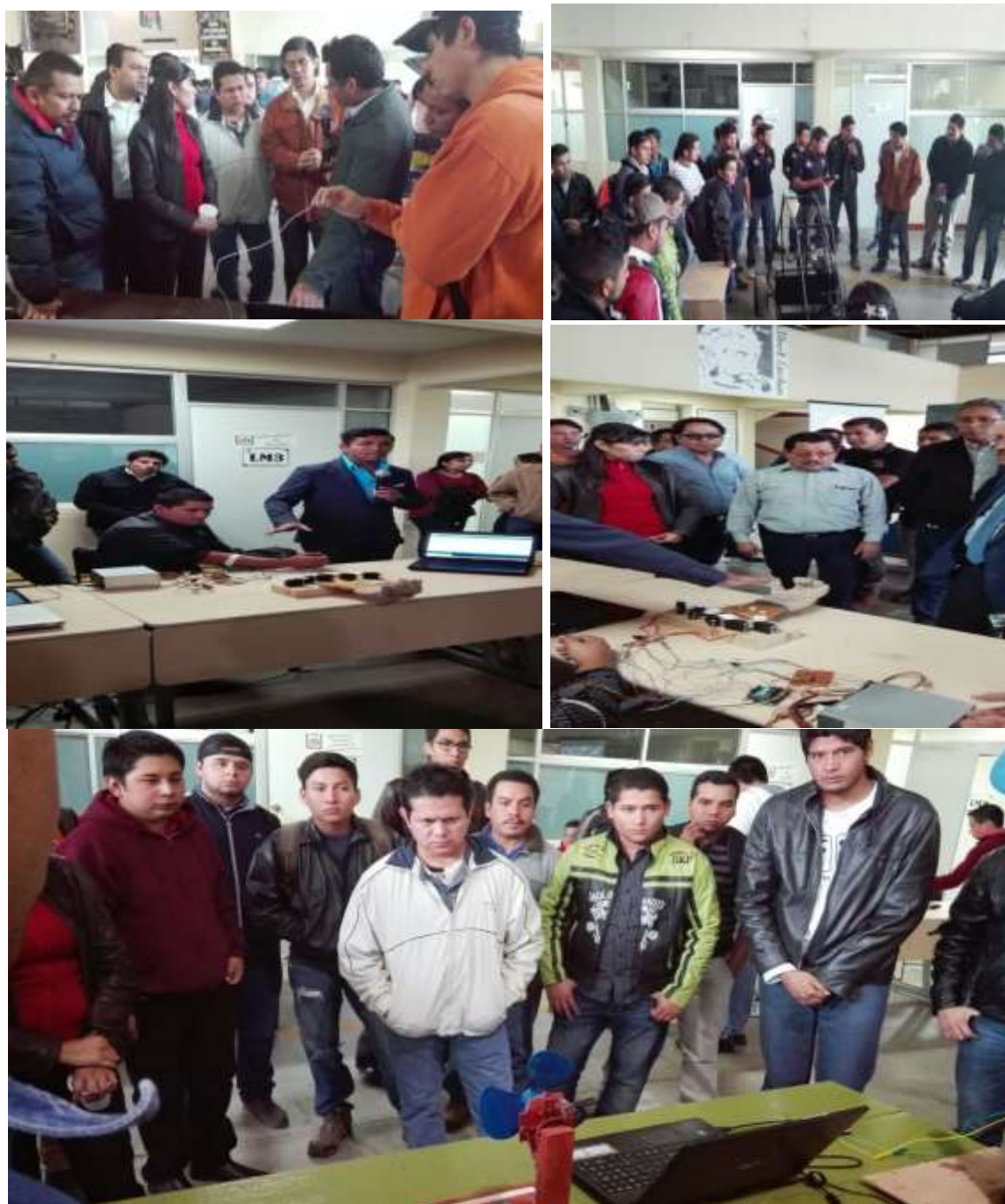
Presentación de proyectos realizado por alumnos de la Carrera de Ing. Mecánica.

En el mes de Diciembre del 2015, la Carrera de Ing. Mecánica presentó los proyectos realizados en diferentes asignaturas