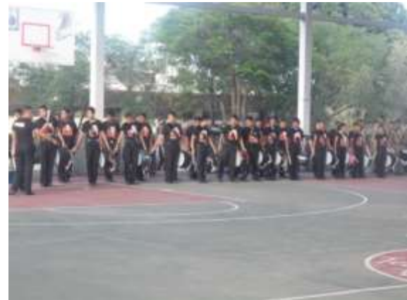
Exhibición de Bandas de Guerra