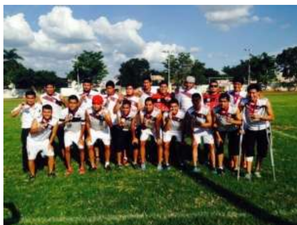
Segundo Lugar Nacional Futbol Varonil