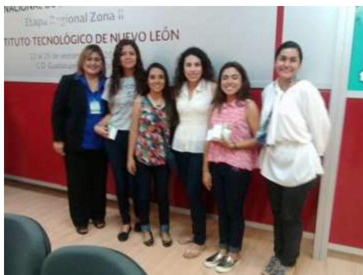
Alumnas de Ingeniera en Gestión Empresarial participando en el Evento Nacional de Innovación etapa regional.