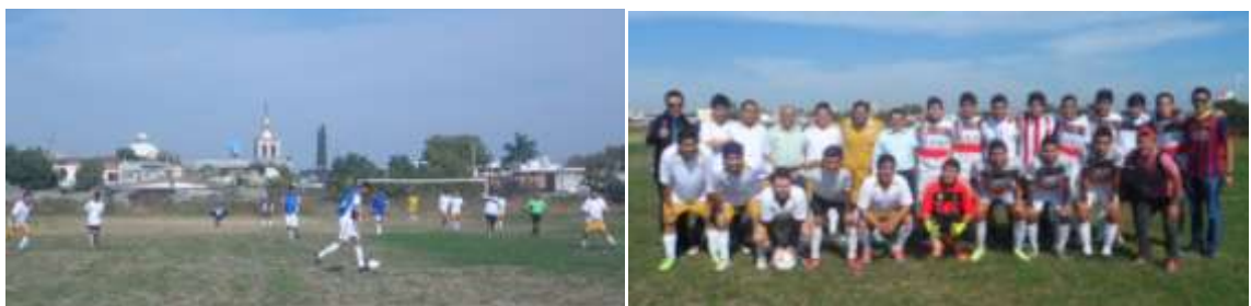
Inauguración del campo de futbol soccer de la institucion.