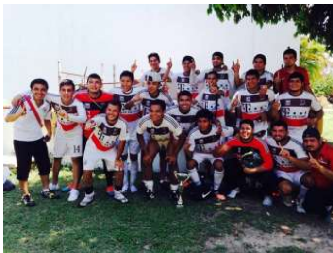
Primer Lugar Futbol Varonil