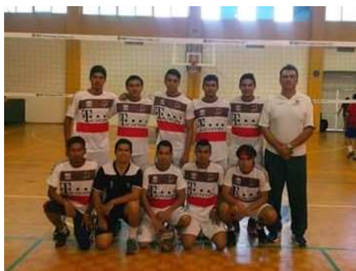
Segundo lugar Volibol Varonil