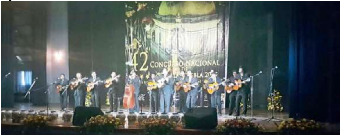
Tercer lugar nacional la rondalla de la institucion sede en puebla

Participación de banda de guerra y escolta regional sede en torreon.