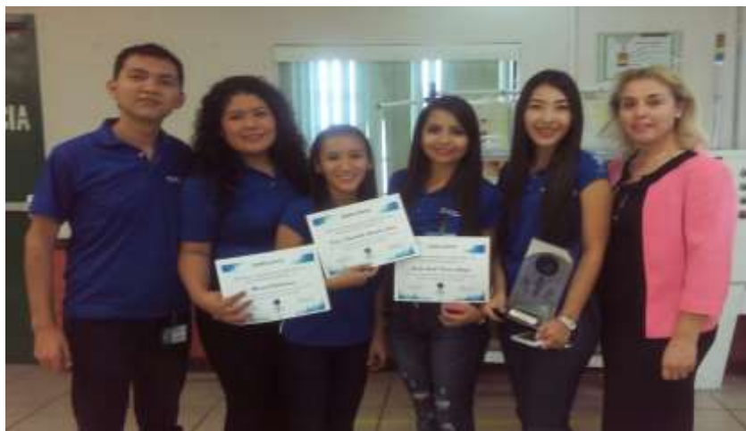
Tabla 16. Resultados del campeonato de de Manufactura esbelta de DELPHI