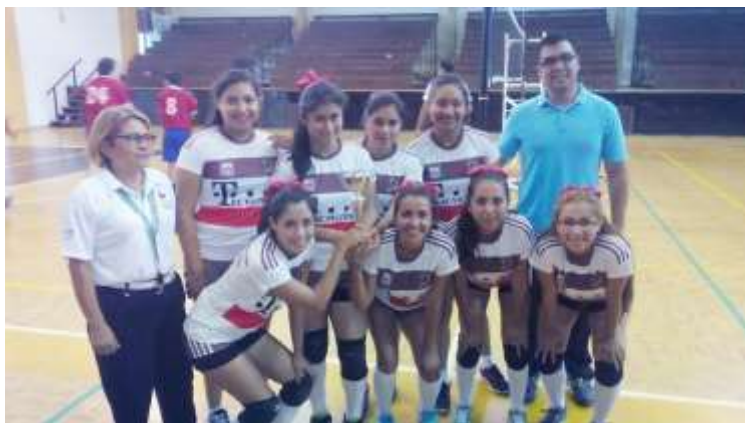
Tercer lugar Voleibol Femenil

LIX Evento Prenacional Deportivo de los Institutos Tecnológicos sede en Ciudad Madero Tamaulipas 2015 y Tecnológico de Durango: Se participó en las disciplinas de béisbol, fútbol femenino, fútbol varonil, básquet bol, volibol y atletismo obteniendo el Tercer lugar el equipo de Volibol Femenil, Segundo Lugar Volibol Varonil y Primer lugar el equipo de fútbol Varonil.