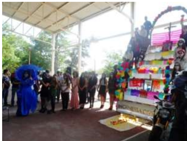
Concurso de altares y ofrendas de día de muertos